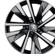
18" Two-Tone Alloy Wheels