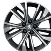
17" MERION, diamond cut, two-tone