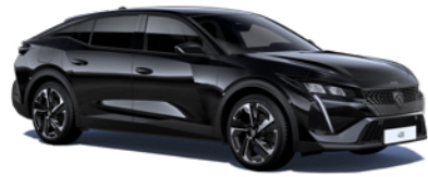
Black Perla Nera