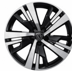
18" Diamond Cut Alloy Wheels