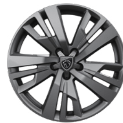
18" Monoton Alloy Wheels